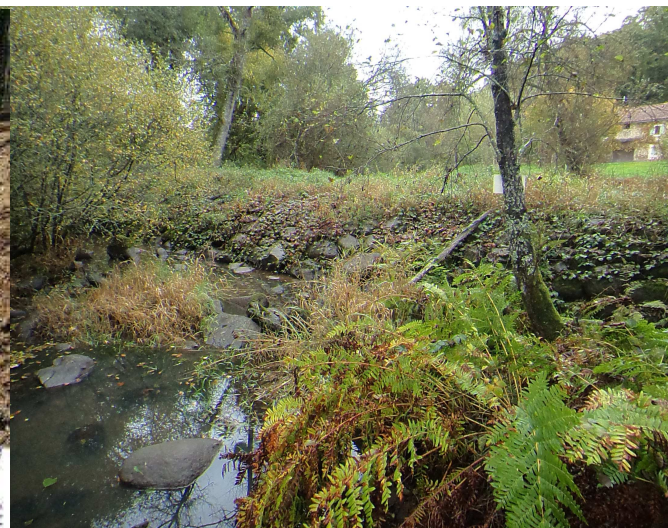
Effacement du seuil de Forge neuve